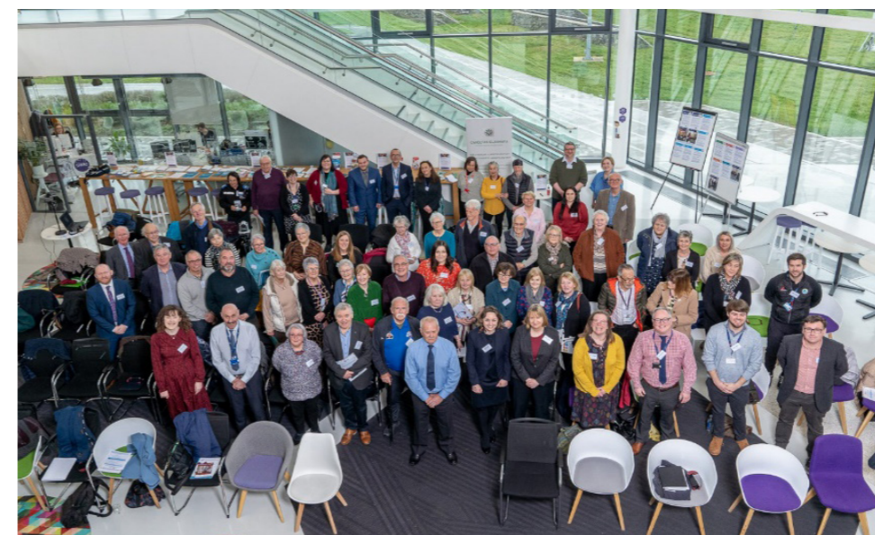
Cynadledwyr y Gynhadledd Oed-gyfeillgar i Fôn, a gynhaliwyd yn M-Sparc, Gaerwen.