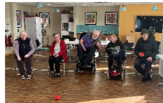
Weithgareddau Dementia Actif a gynhelir trwy gydol y flwyddyn.

dod yn aelod o'r rhwydwaith yn dangos bod y Sir wedi ymrwmo i chwalu'r rhwystrau sy'n gysylltiedig â heneiddio'n dda a chadarnhau statws Ynys Môn yn Ynys oed-gyfeillgar. Cyflwynwyd y cais i Helena Herklots (Comisiynydd Pobl Hŷn Cymru) yn ystod Cynhadledd Oed-gyfeillgar Ynys Môn yn ddiweddar a disgwyliwn ymateb ffurfiol ddiwedd haf 2023.