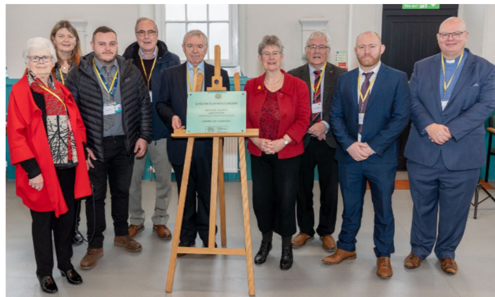
Agor Canolfan Glanhwfa yn ffurfiol – gan Jane Hutt AS, y Gweinidog dros Gyfawnder Cymdeithasol, a gwesteion eraill.

Mae gwasanaeth Dementia Actif Môn yn sicrhau bod pobl sy'n byw gyda Dementia yn cael cyfleoedd i fwynhau gweithgareddau sy'n hybu iechyd a lles. Yn ogystal â chefnogi'r unigolion sy'n byw gyda Dementia, mae'r gwasanaeth, hefyd, yn cefnogi